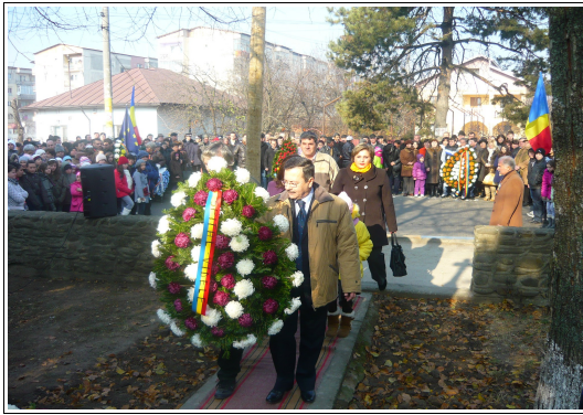
Spitalul Oraşenesc Videle