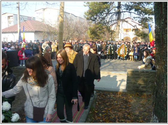
Grupul Școlar Tehnic Videle