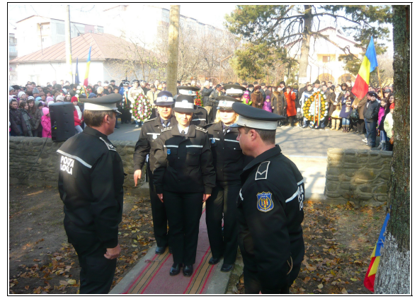
Poliția Locală Videle