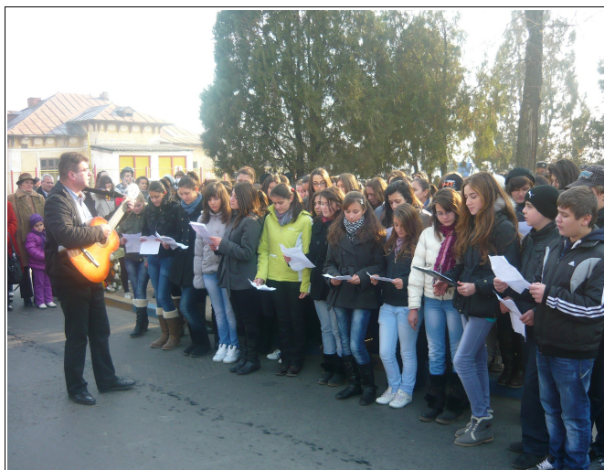
Grupul Școlar Tehnic Videle