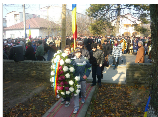
Școala Nr. 3