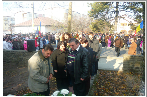
S.C. Publiserv Videle-Poeni.S.R.L.