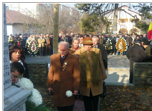
Consiliul Local Videle