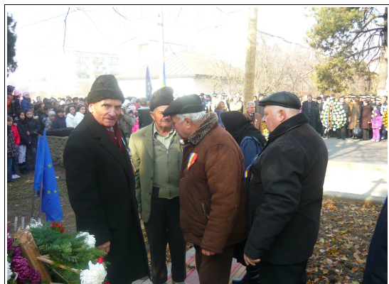
Veteranii de război